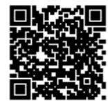
社会貢献支援財団のページでVハートが紹介されています