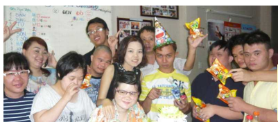
G-CoCoRoでは、毎日の作業をするだけでなく、誕生会を開いて相互に、自分の誕生日をお祝いされることや仲間たちの誕生日をお祝いする楽しみを経験します。