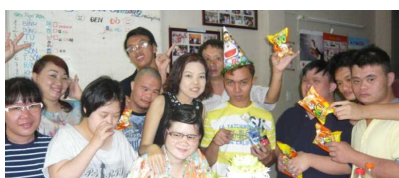
G-CoCoRoでは、毎日の作業をするだけでなく、誕生会を開いて相互に、自分の誕生日をお祝いされることや仲間たちの誕生日をお祝いする楽しみを経験します。