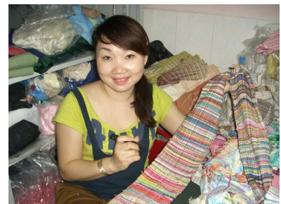
元養護学校教員のホア所長。安定した生活をなげうって、少しでも多くの障がい児者の社会進出が出来る様に、日夜頑張っています。

障がい児者自立支援作業所「G-CoCoRo (ジーココロ)」の設立を支援しました。ベトナム政府からの援助は、知的障害者の作業所ではなく、知的障害者の作業所でうまく機能しているところはほとんどありません。この作業所は、Vハートによる出資率100%のベトナムの作業所です。この作業所にはNPO・Vハートベトナム事務所をおき、作業所の運営支援をしています。現在15人の知的障害者が通所し、3名の指導員とともに作業をしており、彼らの作品はホーチミン市内にあるFamilyMartをはじめとするさまざまな場所で販売されています。それまで家の中で引きこもった生活をしているしかなかった仲間たちでしたが、知的障がいを持ちながらも、毎日作業所に出勤し、仲間とともに働く生活は、彼らだけでなく彼らの家族にも大きな希望をもたらしました。